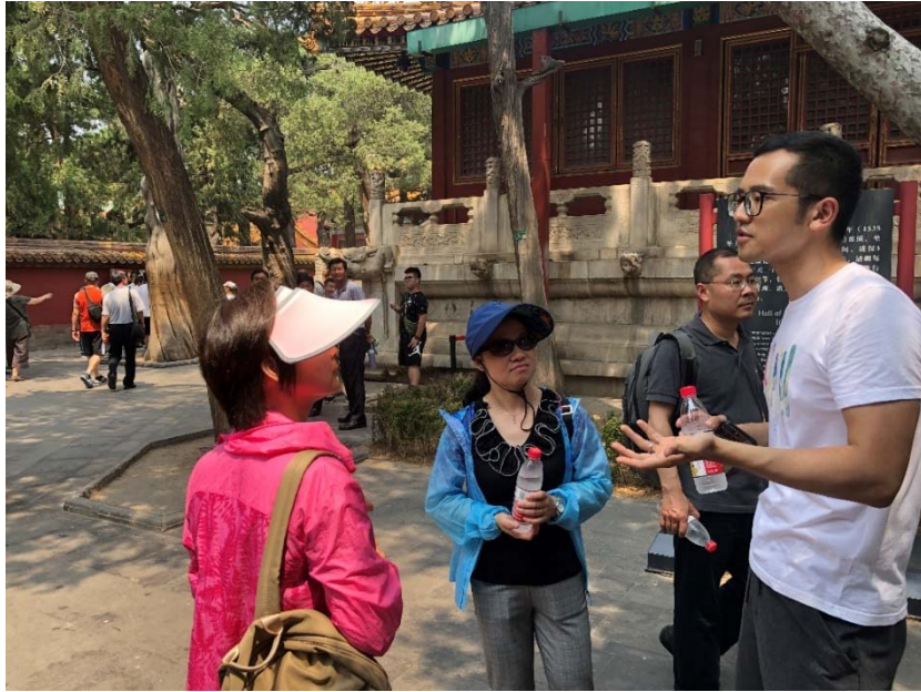
上午 11: 30 分左右此次愉快的半日故宫游活动以 6 人在神武门外的合影结束。